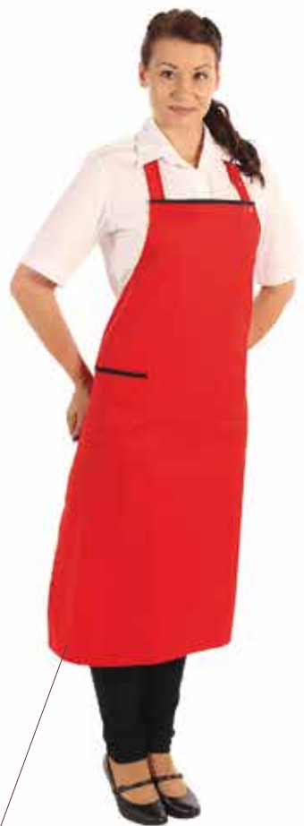
TRÄGERSCHÜRZE MDK Des. 004 052

Breite ca. 75 cm / Länge ca. 100 cm, Träger mit Druckknöpfen verstellbar, 1 Tasche rechts