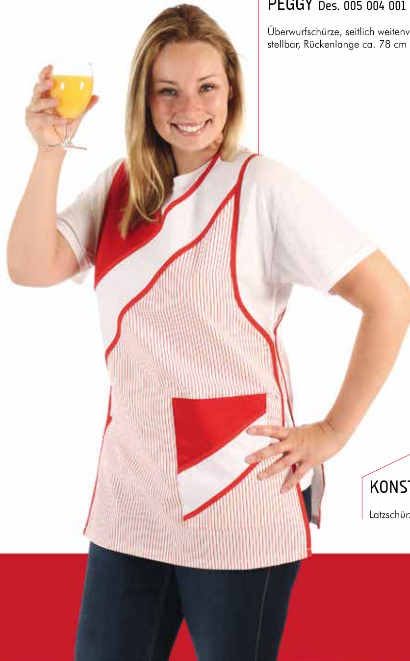
KONSTANZ Des. 005

Überwurfschürze, seitlich weitenverstellbar, Rückenlänge ca. 78 cm