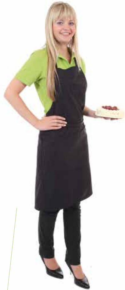
AUGSBURG MT Des. 145

Trägerschürze, hinten überlappend, Träger verstellbar