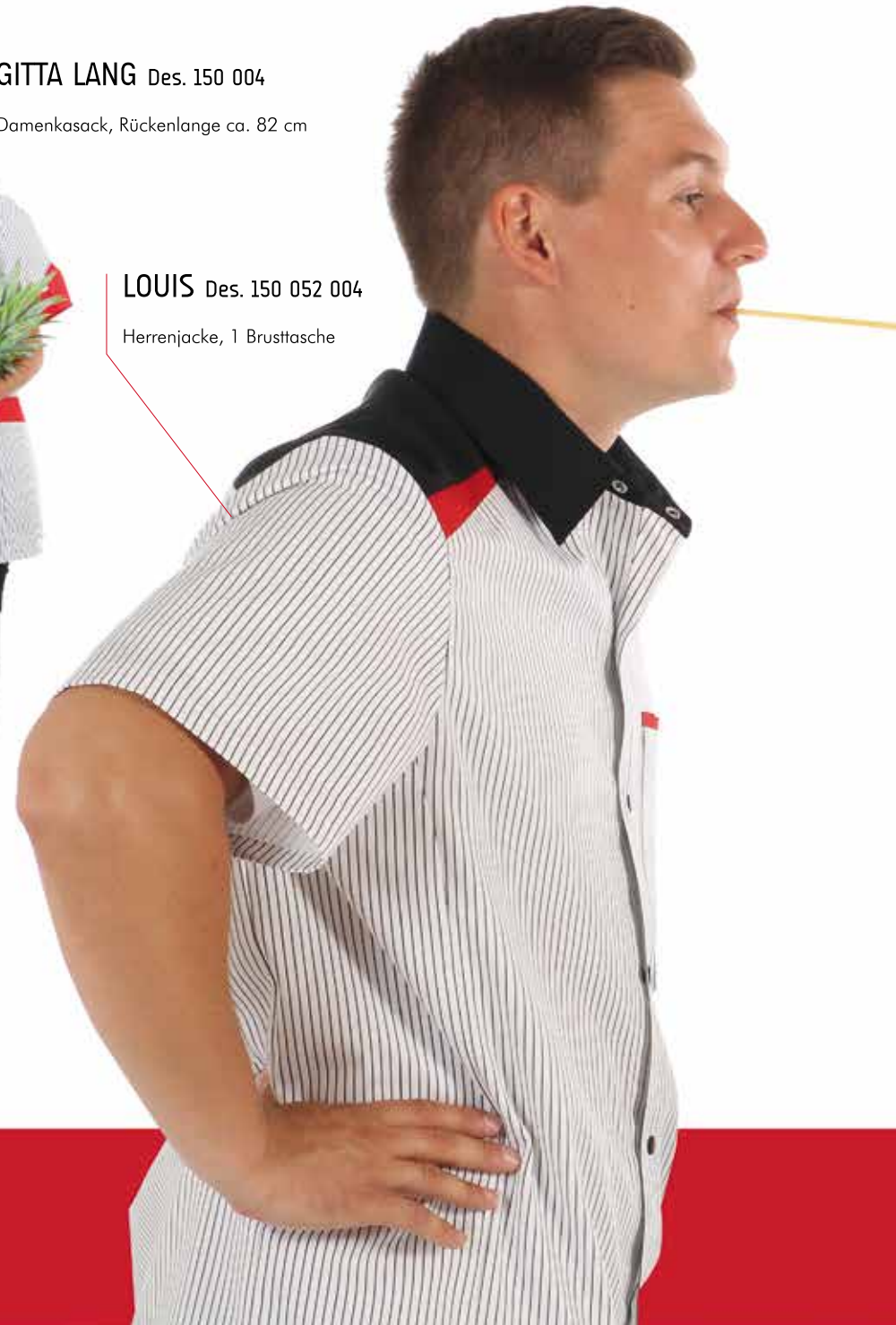
LOUIS Des. 150 052 004