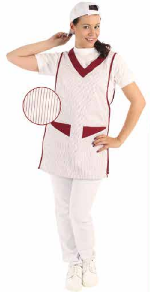
PIA Des. 049 015

Jacke 2-reihig mit Stehkragen, Kragen und Ärmelaufschläge abgesetzt