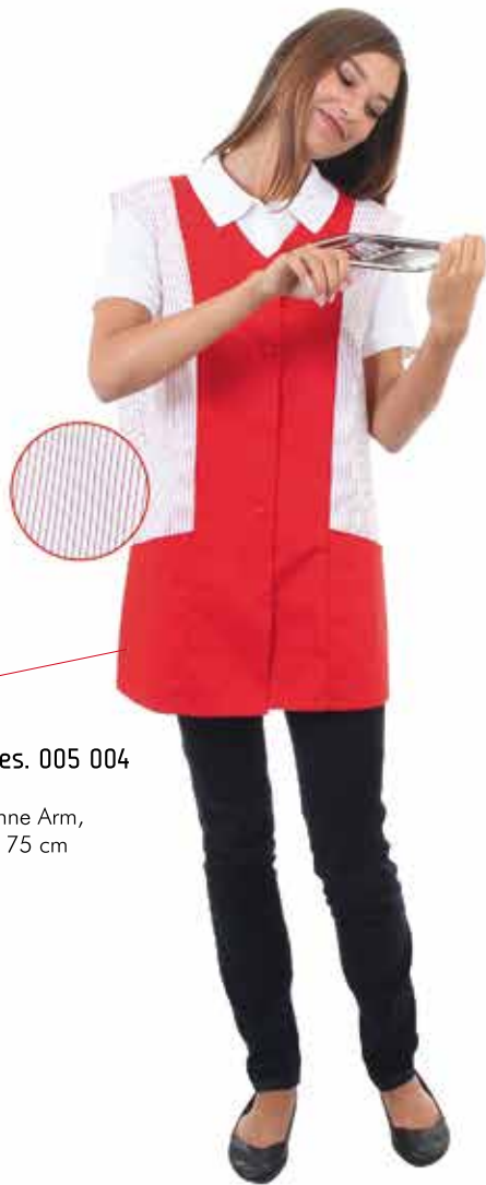
MARLIES Des. 005 004

Damenkasack ohne Arm, Rückenlänge ca. 75 cm