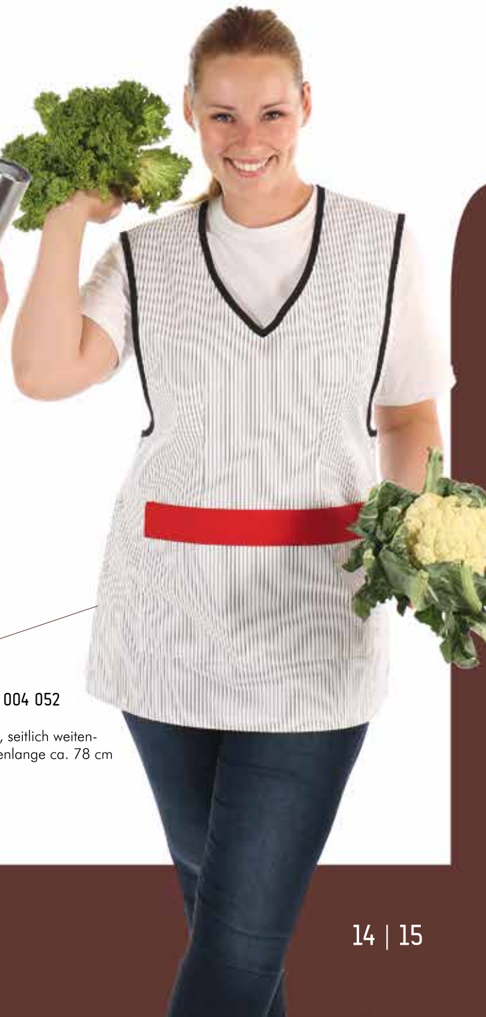
INA Des. 150 004 052

Breite ca. 75 cm / Länge ca. 100 cm, Träger mit Druckknöpfen verstellbar, 2 Taschen, Stickerei „Bestes vom Grill“