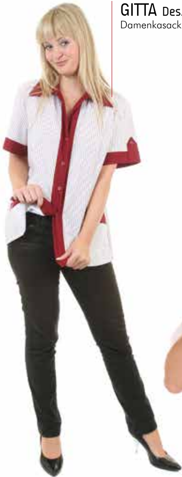
GITTA Des. 049 015 Damenkasack, Rückenlänge ca. 70 cm