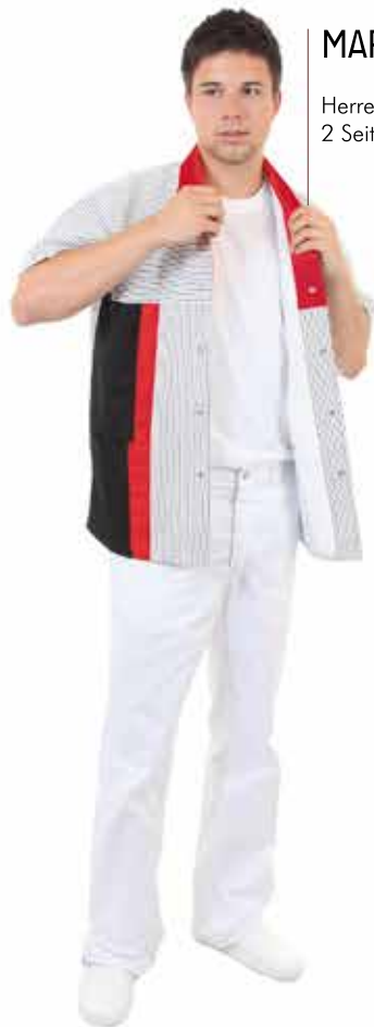
MARCEL Des. 150 052 004

Breite ca. 75 cm / Länge ca. 100 cm, Träger mit Druckknöpfen verstellbar, 1 Tasche rechts