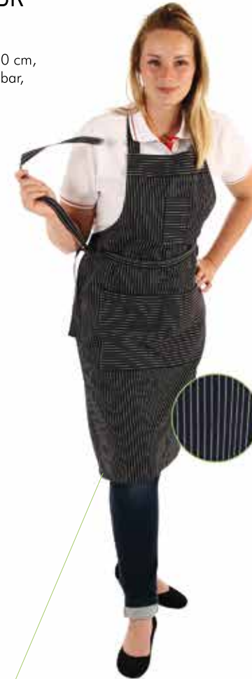
AUGSBURG-MT Des. 144

Breite ca. 75 cm / Länge ca. 100 cm, Träger mit Druckknöpfen verstellbar, 1 Tasche rechts