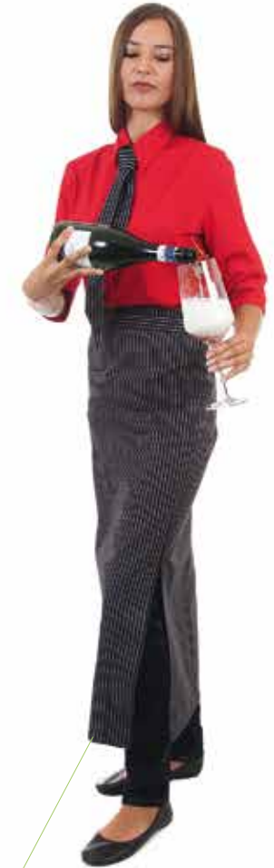
WILLICH Z Des. 144

Trägerschürze, hinten überlappend, Träger verstellbar