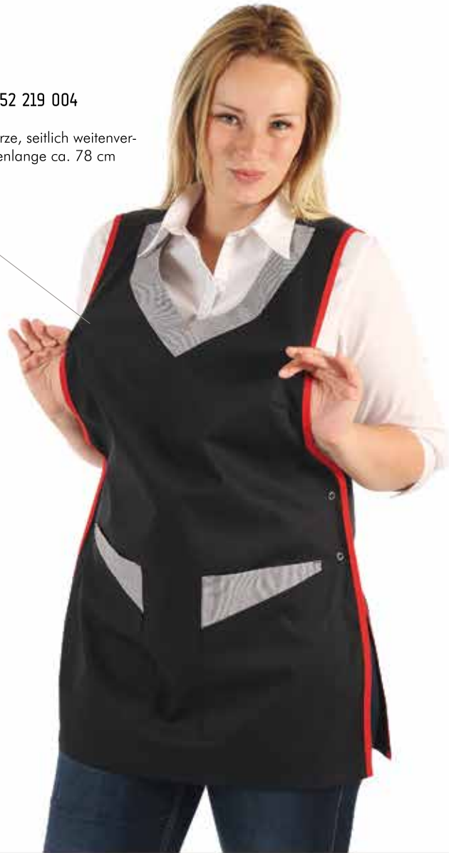
LOUIS Des. 052 004 219

Überwurschürze, seitlich weitenverstellbar, Rückenlänge ca. 78 cm