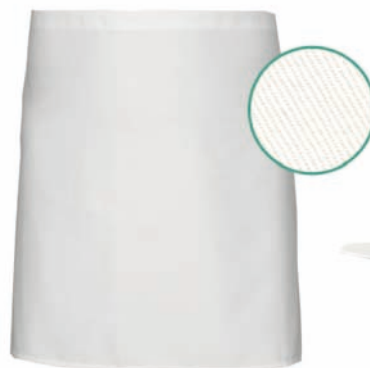
Dessin 032 100% Baumwolle ca. 210g/m 2

(3-er PACK) Alle Bänder aus Schürzengewebe, Breite 90cm / Länge 50cm, VE: 3 Vorbinder je Pack