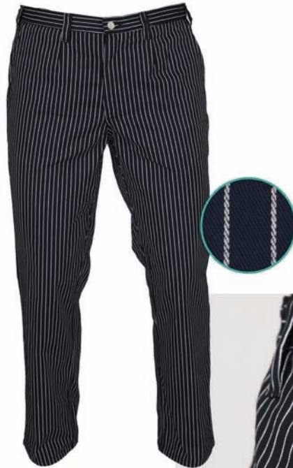
Dessin 079 100% Baumwolle ca. 200g/m 2