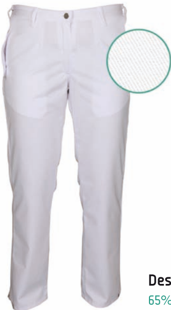
Dessin 002 65% PE | 35% BW ca. 245g/m 2

Hosenschlitz mit Reißverschluss, 2 Seitentaschen, Gummizug im Rückenteil, Gürtelschlaufen, Größen: 36 - 52 (weitere Größen möglich, aber kein Standard)