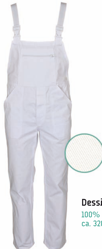
Dessin 044 100% Baumwolle ca. 320g/m 2

2 aufgesetzte Seitentaschen, 1 Latztasche mit Reißverschluss, 1 Gesäßtasche, elastische Träger, Größen: 48 – 64 (weitere Größen möglich, aber kein Standard)