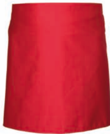
Dessin 004 65% PE | 35% BW