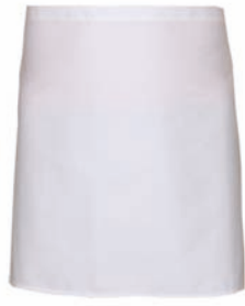
Dessin 001 65% PE | 35% BW