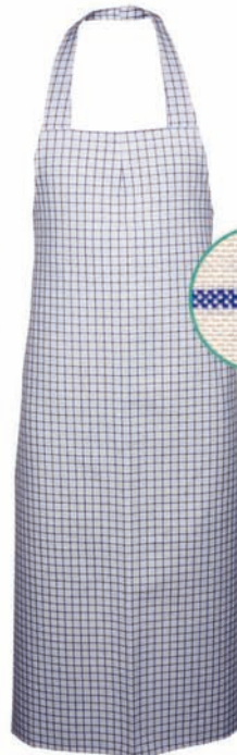
Dessin 102 50% LI | 50% BW ca. 235g/m 2