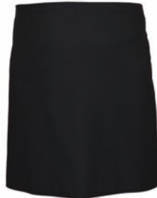
Dessin 052 65% PE | 35% BW