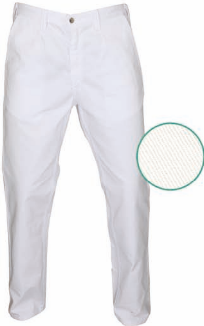
Dessin 031 100% Baumwolle ca. 270g/m 2

Hosenschlitz mit Reißverschluss, 2 Seitentaschen, 1 Gesäßtasche, besonders stabile Nahtverarbeitung, Gummizug im Rückenteil, Gürtelschlaufen, Dessin 031 Größen: 46 – 64 / 24 – 31 / 86 – 114, Dessin 079 Größen: 46 – 64 (weitere Größen möglich, aber kein Standard)