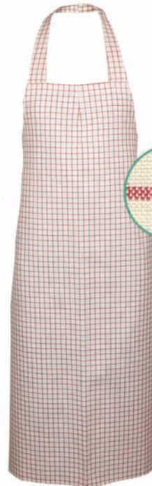
Dessin 103 50% LI | 50% BW ca. 235g/m 2