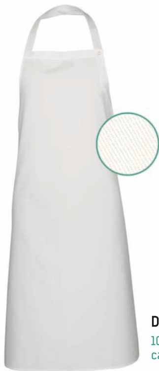
Dessin 032 100% Baumwolle ca. 210g/m 2

(3-er PACK) Alle Bänder aus Schürzengewebe, Halsband mit Druckknöpfen verstellbar, Breite 77cm / Länge 110cm, VE: 3 Schürzen je Pack