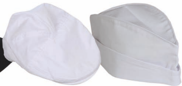
M 00 23

(M 0023) Einheitsgröße, mit Klettverschluss, Druckknopf am Schild, Polycotton, waschbar, VE: 10 Stück