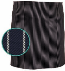
Dessin 144 65% PE | 35% BW

Alle Bänder aus Schürzengewebe, Breite ca. 90cm / Länge ca. 50cm