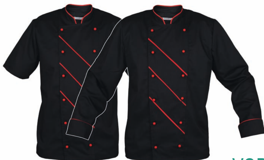
Dessin 052/004 65% PE | 35% BW

1/2 Arm mit Paspel am Kragen und im Frontbereich, Ärmeltasche, Knöpfe nicht im Lieferumfang enthalten, Größen: 46 – 64