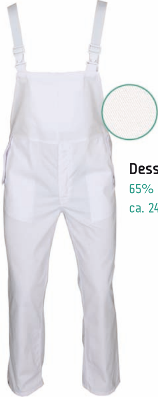
Dessin 002 65% PE | 35% BW ca. 245g/m 2

Herrenlatzhose , 2 Seitentaschen mit Patte verschließbar, 1 Latzinnentasche, Beinabschluss mit Druckknöpfen verstellbar, elastische Träger, Größen: 48 – 64 (weitere Größen möglich, aber kein Standard)