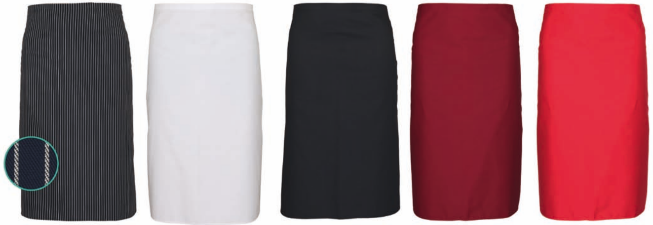
Dessin 144 65% PE | 35% BW

Alle Bänder aus Schürzengewebe, Breite ca. 100cm / Länge ca. 80cm