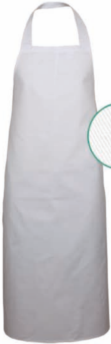
Dessin 033 100% Baumwolle ca. 230g/m 2

Halsband aus Schürzengewebe, Bindeband aus Köperband, Abnäher in Latz, Breite: 100cm, Längen: 100; 105; 110; 115; 120; 125; 130cm