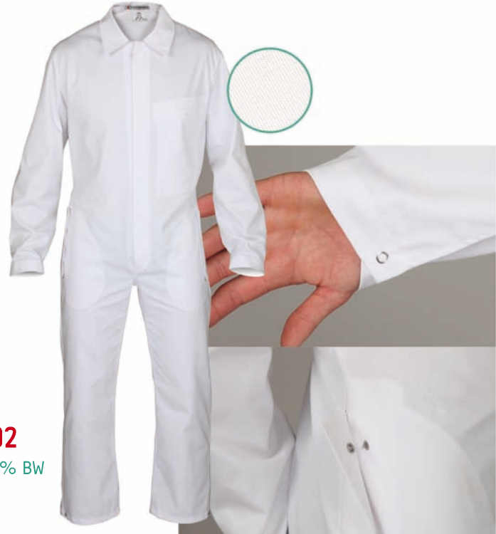
Dessin 002 65% PE | 35% BW ca. 245g/m 2

Herrenoverall , verdeckte Druckknopfleiste, 2 Seitentaschen mit Patte verschließbar, 1 innenliegende Brusttasche mit Patte, Arm- & Beinabschluss mit Druckknöpfen verstellbar, Größen: 48 – 64 (weitere Größen möglich, aber kein Standard)