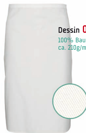
Dessin 032 100% Baumwolle ca. 210g/m 2

1/1 Arm mit Paspel am Kragen und im Frontbereich, Ärmeltasche, Knöpfe nicht im Lieferumfang enthalten, Größen: 46 – 64