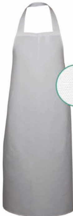
Dessin 101 50% LI | 50% BW ca. 220g/m 2