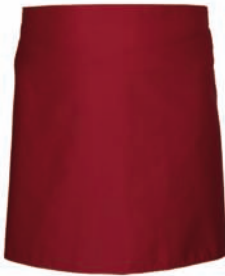
Dessin 015 65% PE | 35% BW